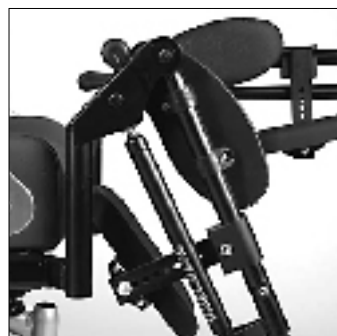
Mechanisch hochschwenkbare Fussraste