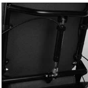
Rückenwinkelverstellung über Gasdruckfeder