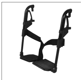
Fussstütze geteilt mit Alu Fussplatten