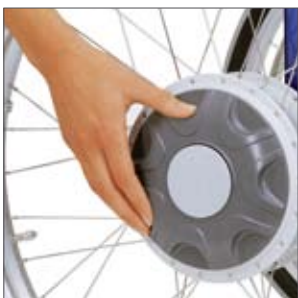
Antriebsräder einfach aus- oder einkuppeln