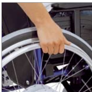
Per Hand anschieben oder elektrisch fahren: ganz wie Sie wollen!

Sie bleiben flexibel – zwei Rollstühle in einem!