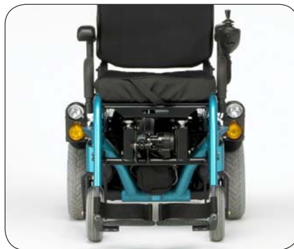
Optional auch mit Licht und Blinker. Für ein sicheres Fahren auch in der Dunkelheit und zum Signalisieren beim Abbiegen.