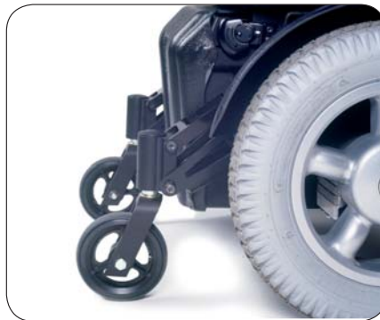
... und sich dem Gelände anpassen.