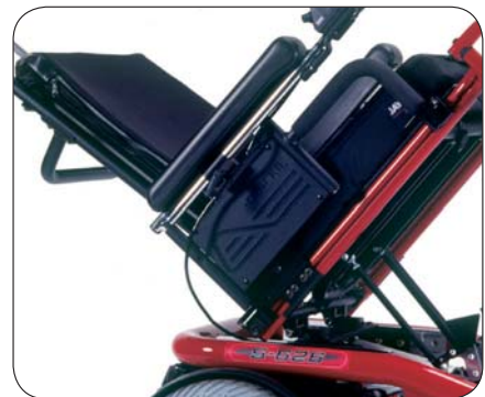
Sitzeinheit kippbar bis 53°. Mit integriertem Schwerpunktausgleich.