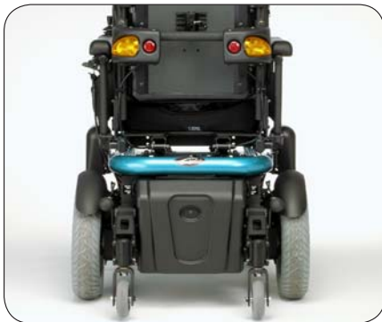
2 Antikippstützen (mitfedernd), welche Ihre Sicherheit garantieren ...

Die Option elektrische Sitzneigungsverstellung (C.G. Tilt) ermöglicht die komplette Sitzeinheit bis 53° zu kippen und eine absolute Entlastung des Patienten zu gewährleisten. Dabei wird gleichzeitig die ganze Sitzeinheit nach vorne verlagert, um einerseits den Schwerpunkt und somit die gewünschte Fahreigenschaft beizubehalten und andererseits die Sicherheit zu garantieren. Zudem passen sich die 2 beweglichen Antikippstützen automatisch dem Gelände an.