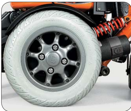
Hinterradbefestigung mit vier Schrauben. Felge zudem für einen einfachen Reifenwechsel geteilt.