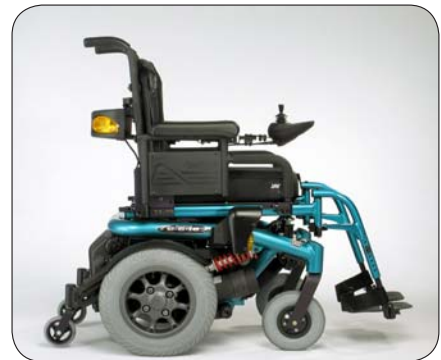
Die Federbeine und die zentrale Hinterradpositionierung mit dem optimalen Schwerpunktausgleich. Ein komfortables und bewegliches Fahren!