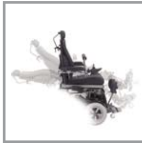
Beinstützen und Rückenlehne sind unabhängig voneinander verstellbar