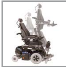
Mit der vertikalen Kombination gehen Sie aus der Sitzposition in den Stand und fahren im Stand weiter