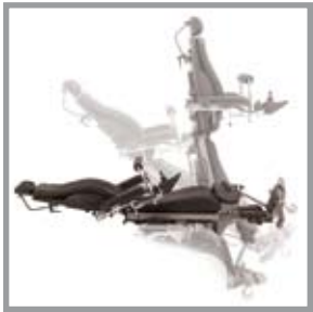
Sie können aus jeder Position heraus aufrecht stehen, sogar aus der Liegeposition

Mit der vertikalen Funktion kann der Benutzer auf unterschiedliche Art und Weise in den Stand gelangen. Durch das speziell angepasste Sitzsystem kann der Benutzer seine Stehposition individuell bestimmen und optional in der stehenden Position ebenso eine Fortbewegung "Fahren im Stand" realisieren. Der modulare Entwurf des Körpersitzsystems garantiert eine optimale Passform. Die erhöhte Unabhängigkeit und Freiheit, sowie die medizinischen und psychologischen Vorteile, die man durch den Stand genießt, sind von unschätzbarem Wert.