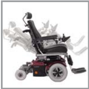
Elektrisch verstellbare Sitzkantung

Regulierbare Sitzmaße und elektrische Bedienelemente sorgen beim modularen Design des Corpus-Sitzsystems für verbesserte Funktionalität. Der Corpus entstammt dem Entwurf einer der weltweit führenden Ergonomen. Das Resultat ist ein Sitzsystem, das sich den natürlichen Körperformen vollständig anpasst. Die Anpassungsfähigkeit des Corpus-Sitzsystems ist schier unendlich. Die verschiedenen Module des Sitzsystems lassen sich in Tiefe, Breite, Höhe und Winkel regulieren und anpassen. Der ergonomisch geformte Sitz und die auf Wunsch erhältlichen elektrischen Bedienelemente machen den Corpus zum beliebtesten Sitzsystem der Welt.