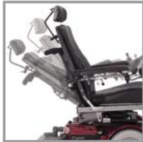
Elektrisch verstellbare Rückenlehne