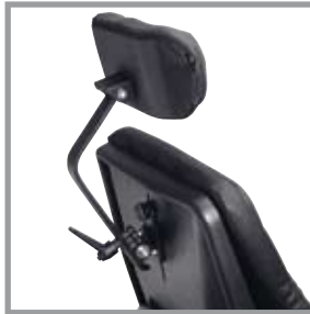
Kopfstütze verstellbar in Höhe, Tiefe und Winkel