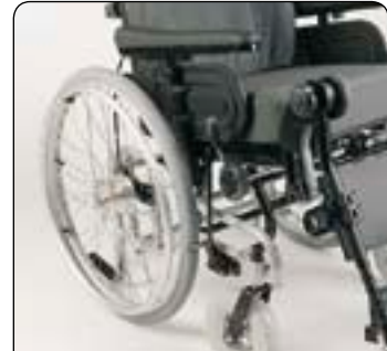
Trommelbremse für 12", 16", 22" und 24" Hinterräder Erhöhte Sicherheit durch verbesserte Bremswirkung.