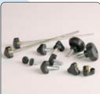
Klinik-Kit Für alle Standardeinstellungen. Kein Werkzeug erforderlich.