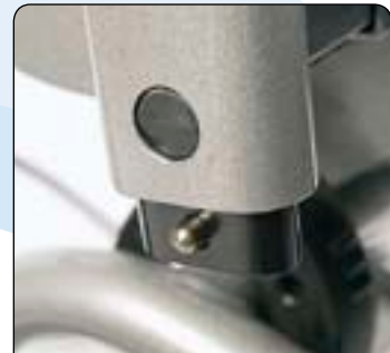
Automatische Armlehnenverriegelung Sichert die abnehmbare Armlehne gegen Herausrutschen.