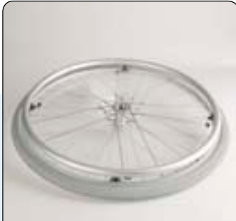
Hand- und Speichenschutz Frost