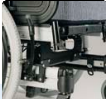
Einarmbremse (Rea® Bellis) Durch Betätigen des Hebels auf einer Seite werden beide Bremsen aktiviert.