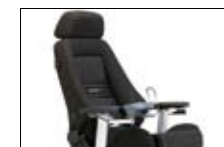
Recaro Specialist Sitze