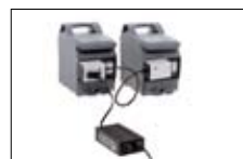
Ladeadapter für Akkus