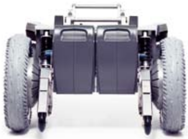
Zwei Akku-Packs für bis zu 45 km Reichweite und als Reservesystem.

* 12 km/h Version benötigt zwei Akku-Packs um die maximale Geschwindigkeit zu erreichen.