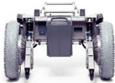
Ein Akku-Pack für weniger Gesamt- und Transportgewicht.