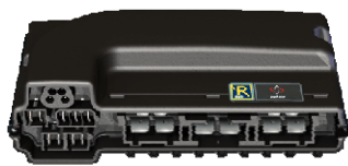
Motorsteuerung EL PM90