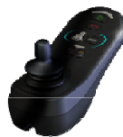
LED ohne Licht