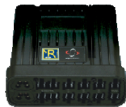
Modul Sitz und Licht ISM-6L