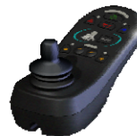
LED mit Licht