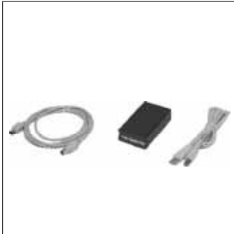
IR Empfänger Mouseemulation