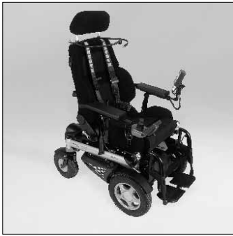
Saug- / Blassteuerung